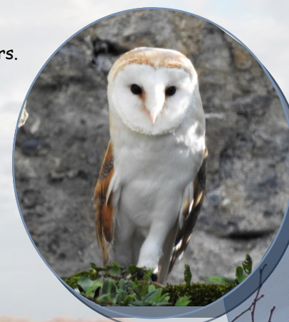
Effraie des clochers