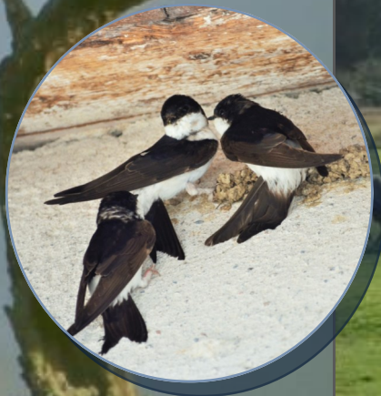
Hirondelles de fenêtres