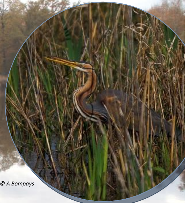
Héron pourpré