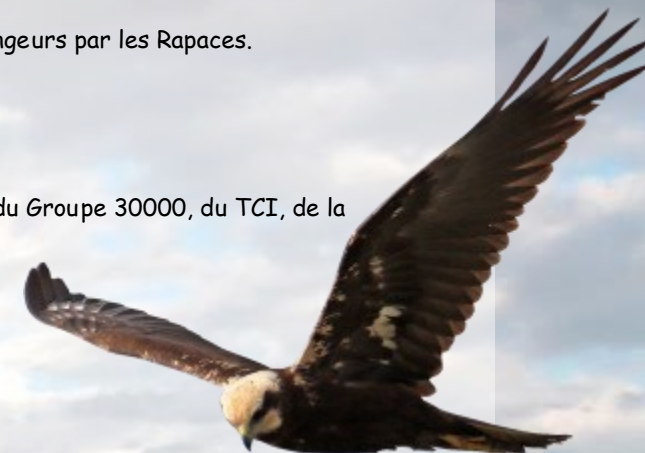
Busard des roseaux