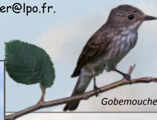
Gobemouche gris

Oiseaux de nos Fermes et de nos Vignobles