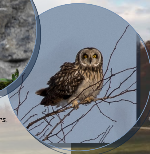
Hibou des marais