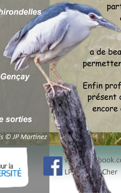
Bihoreau gris