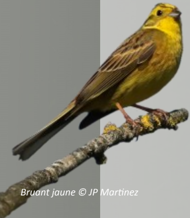
Bruant jaune

Assez grand, longue queue (une obsession direz-vous), plumage à dominante ?...jaune ! (vous avez gagné), chant vraiment typique, reconnaissable pour Henry, notre ornitho. Il a 3 notes, la première est répétée comme une ritournelle, la seconde est une courte note aiguë et continue, enfin le chant se termine par la troisième plus grave que la première et étirée "tatatatata-tsiiii-tuuuuuu".