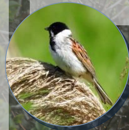
Bruant des roseaux