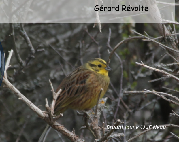
Bruant jaune

Mes sources : l'Etymologie des noms d'oiseaux / Cabars et Chauvet