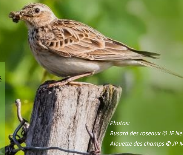
Photos: Busard des roseaux © JF Neau Alouette des champs © JP Martinez