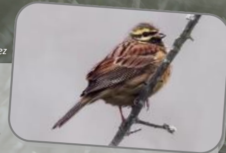
Bruant zizi

Vol à longues modulations. « Jaune » vous l'avez deviné car citrinella vient du latin citrus : le citronnier (vous voyez c'est simple l'ornithologie) plus ella (couleur citron. Bientôt, vous saurez tout, tout...sur les Bruants.